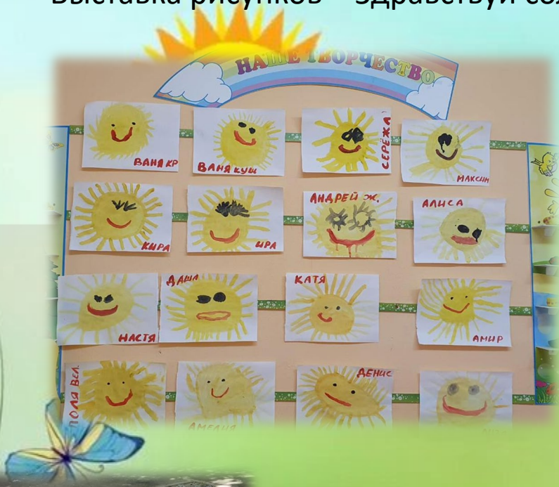
Выставка рисунков – Здравствуй солнце