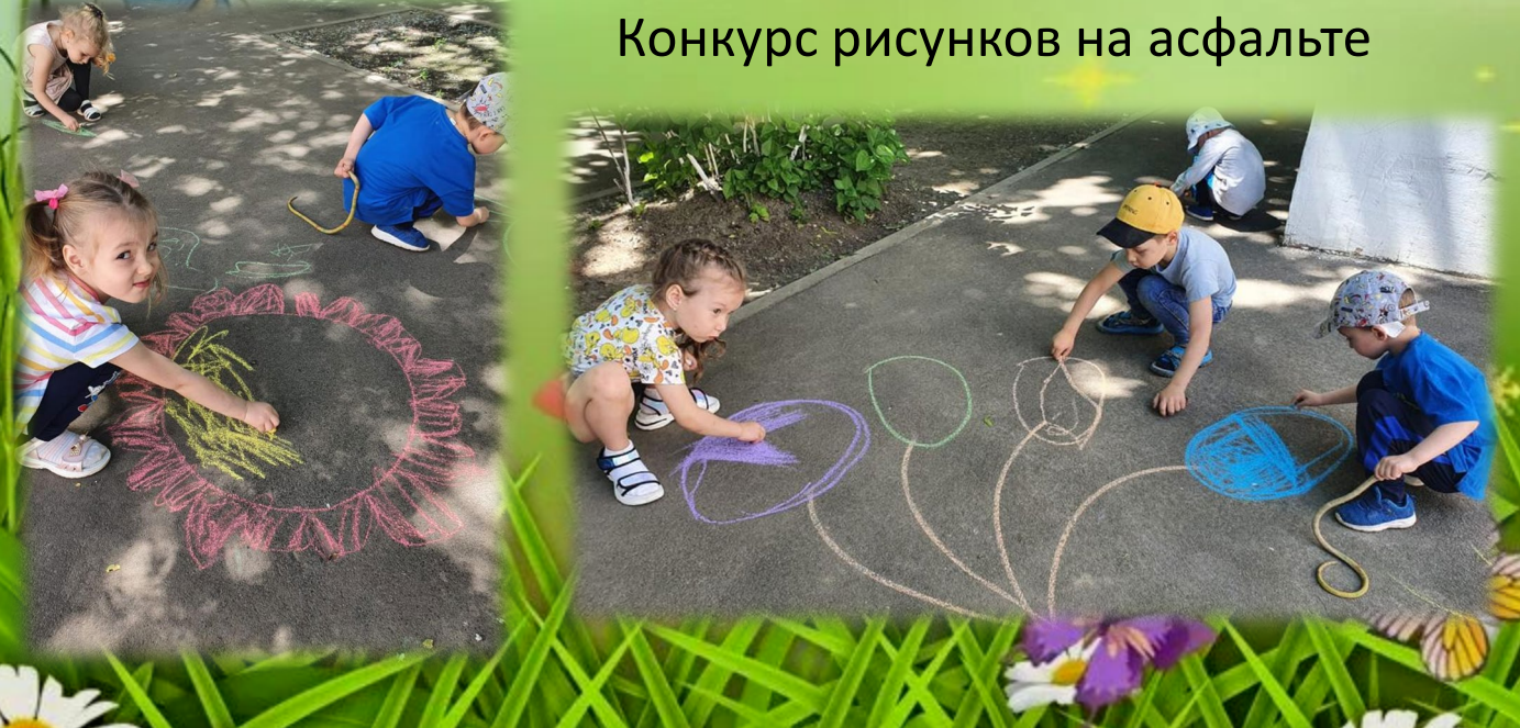
Конкурс рисунков на асфальте